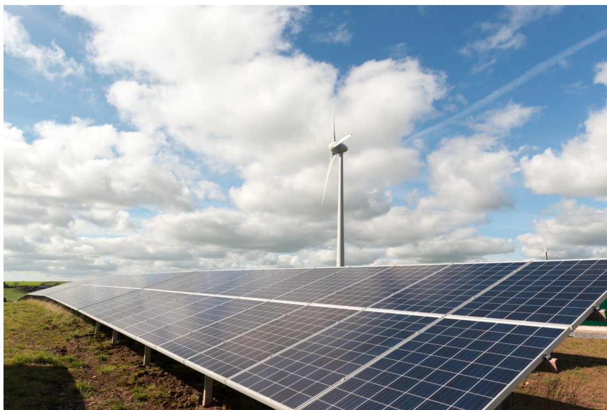
Foto: Vattenfall zonnepark Cynog in Wales

Let op! U belegt buiten AFM-toezicht. Geen prospectusplicht voor deze activiteit.