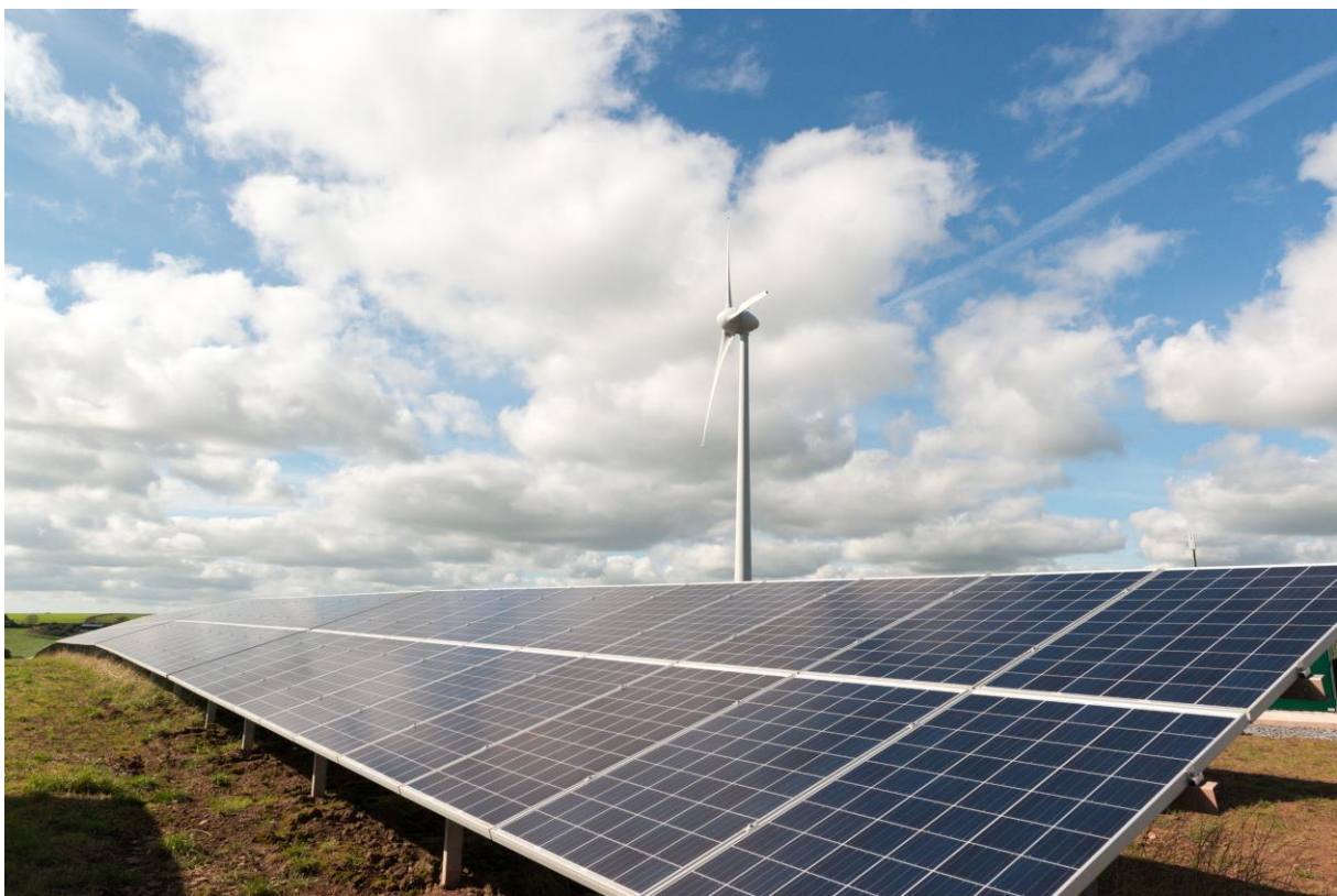
Foto: Vattenfall zonnepark Cynog in Wales

Let op! U belegt buiten AFM-toezicht. Geen prospectusplicht voor deze activiteit.