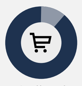
27 miljoen m<sup>2</sup> winkeloppervlak