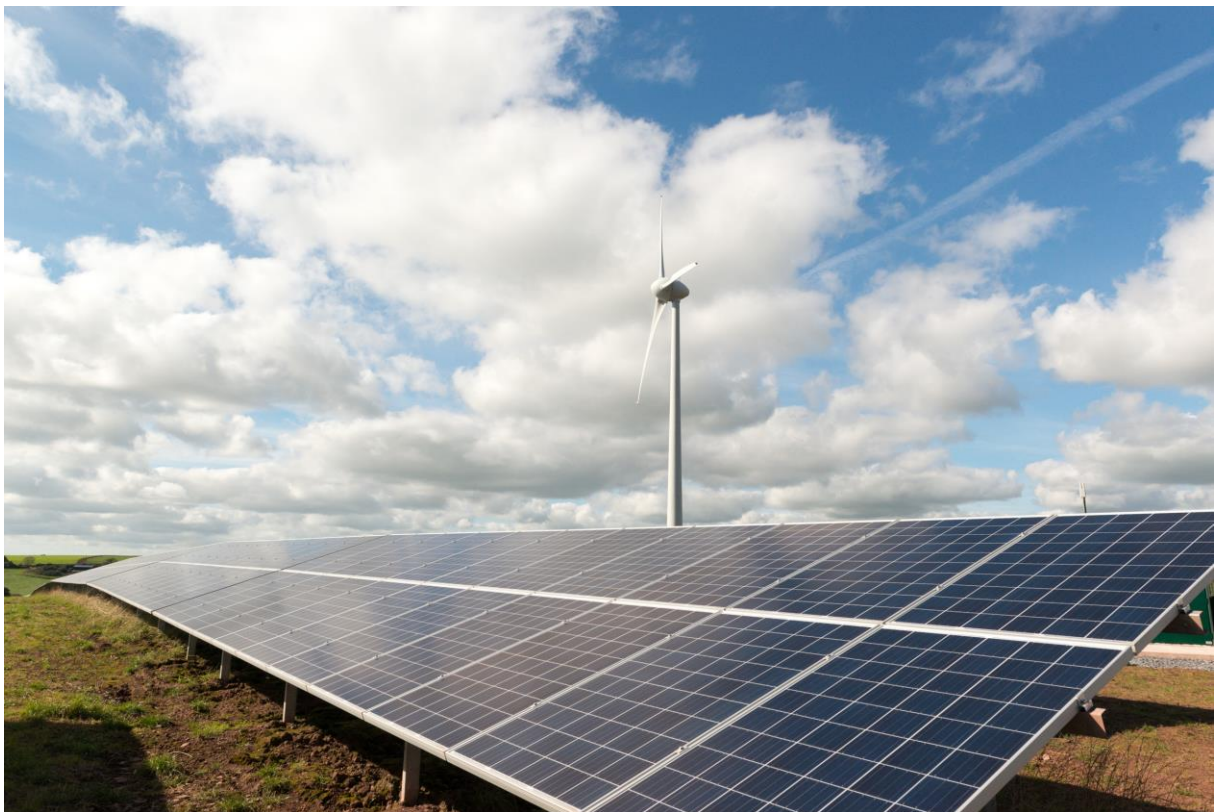
Foto: Vattenfall zonnepark Cynog in Wales

Let op! U belegt buiten AFM-toezicht. Geen prospectusplicht voor deze activiteit.